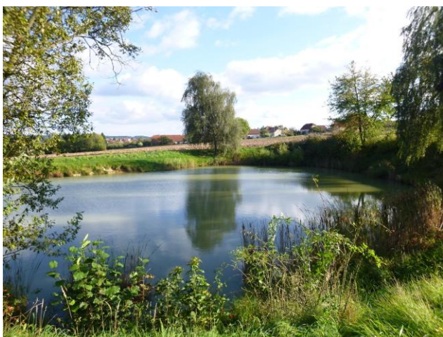
Jedno z rudických jezírek.