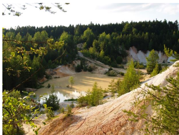
Lom Seč u silnice vedoucí na Olomučany

Z Vilémovic vyrážíme po silnici č. 373 směr Jedovnice. Krátce za obcí silnici opustíme, u kaštanů s informačním panelem zahneme vpravo a přes krasovou plošinu Harbechy následujeme červenou turistickou značku. Přehoupneme se přes vrch Strážné a míříme do Rudice. Na vjezdu do obce odbočíme vpravo ke stavebninám. Silnička nás dovede k červené turistické značce, na kterou se opět napojíme. Čeká nás cesta kolem rudických jezírek, zatopených dolů na železnou rudu.