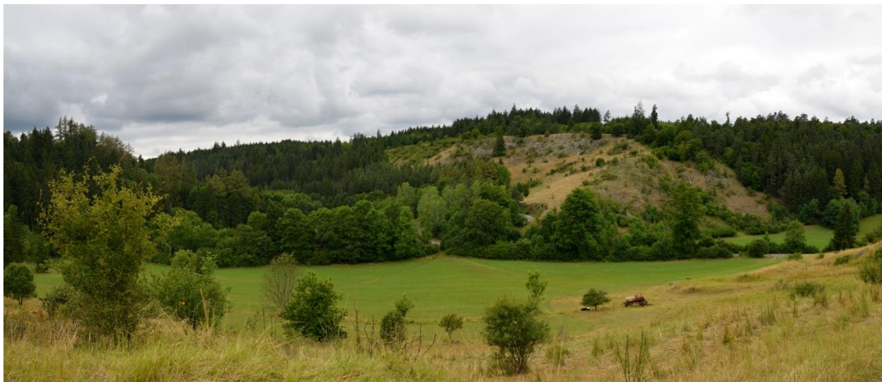
Macošská škrapová stráž s obnaženými bílými vápenci. Zatímco žleby (ostrá krasová údolí) jsou stinné a chladné, škrapová pole se svým charakterem blíží stepím.

Hlavní cestu pustíme v místě, kde silnice tvoří ostré písmeno U a šplhá do kopce k Macoše. Právě v tomto „Účku“ odbočíme vlevo na silničku (cyklostezka č. 5, přepaženo závorou), která nás provede Suchým žlebem až na Skalní mlýn. Po necelém kilometru se na silničku z levé strany napojí zelená turistická značka. Čeká nás dlouhý mírný sjezd, který končí u Kateřinské jeskyně, nově budovaného Domu přírody a Skalního mlýna.