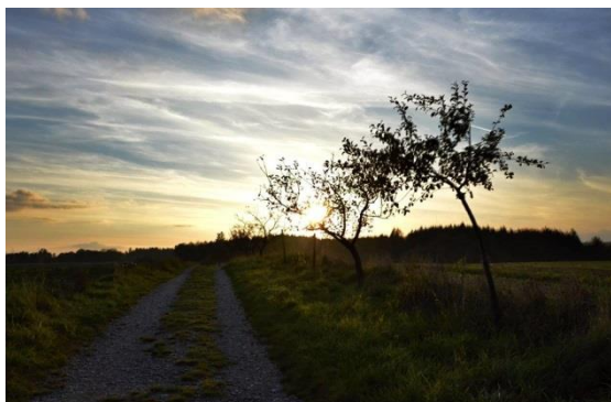
Ostrovská plošina

Výlet si lze obohatit zájžděkou do Ostrova u Macochy. Dovede nás tam cyklotrasa č. 5082, která odbočuje z hlavní silnice vedoucí od Macochy v místě, kde začínají serpentiny. Zpevněná cesta vede po Ostrovské plošině kolem závrťů a nabízí krásný výhled. V Ostrově následujeme červenou značku a kolem kamenného větrného mlýna projedeme do centra obce. Na křižovatce odbočíme vpravo a z kopce kolem Ostrovské propasti sjíždíme k hlavní silnici č. 373. Odbočíme vpravo a po silnici, kolem jeskyně Balcarů, míříme do Vilémovic.