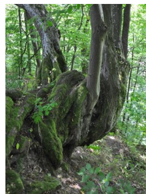
Opilý strom v suťovém poli. Takové exempláře lze ve žlebech spatřit běžně.

Odtud pokračujeme proti proudu Punkvy k Punkevním jeskyním. V této části Pustého žlebu nám společnost bude dělat Naučná stezka Macocha. U Punkevních jeskyní využijeme služeb lanovky, která nás i s koloběžkami vyveze na Macochu. Odtud nás čeká svižný sjezd do údolí pod Vilémovicemi a výstup směrem k půjčovně.